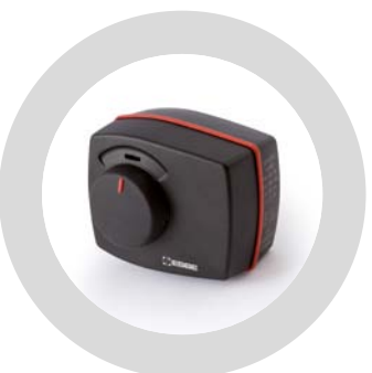
Servomotor zmiešavacieho ventilu