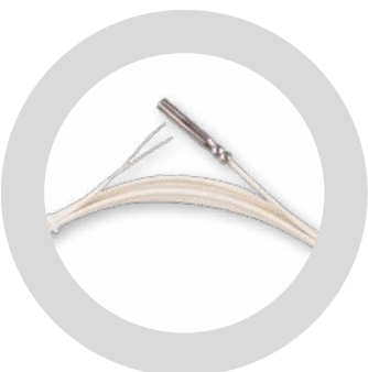
Snímač teploty spalín